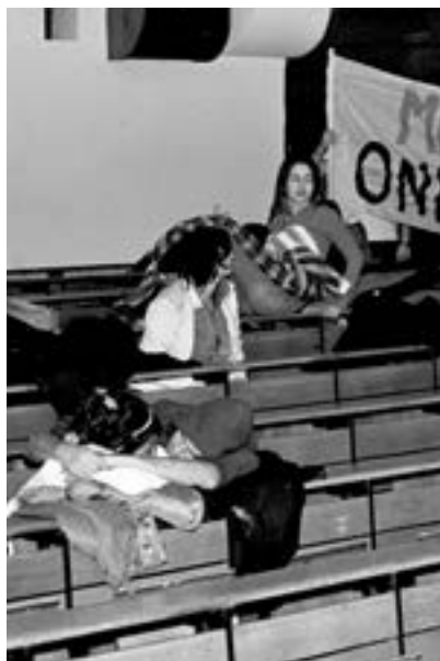
Blokada Filozofskog 2011.

u njoj učestvovali bitna, jer smo tada naučili mnogo o tome kako svet funkcioniše, ali i kako treba da se organizujemo da bismo ga promenili. Na tom primeru na malom pokazu se svi mehanizmi funkcionisanja društva, ogole se institucije, interesi i pozicije. A način organizovanja, zborovi ili plenumi kao mesto gde se donose odluke su nešto što je prisutno u skoro svakom vidu sličnih borbi i naša praksa na blokadi nas je naučila kako da kasnije koristimo sve te me-