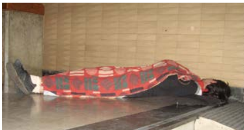
Blokada Filozofskog 2011.