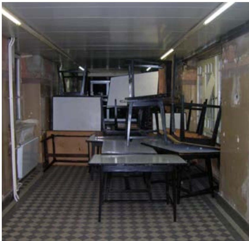
Blokiran hodnik na Arhitektonskom 2007.