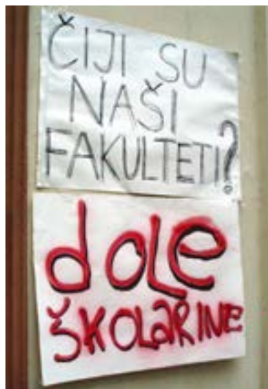
Plakati na vratima Rektorata BU 2006.