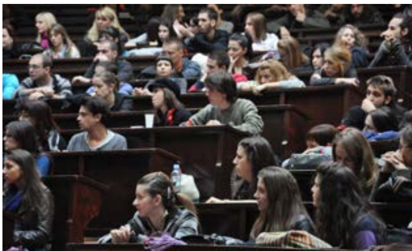
Zbor na Arhitektonskom 2007.

Kada se radi o odlučivanju i organizaciji, plenum ili zbor studenata bio je forma koja se često koristila u prošlim borbama i učesnici tih borbi ga slave do mere da se nekad čini da je uspešan zbor veće postignuće studentskog organizovanja od ispunjenja zahteva. Taj impuls treba razumeti, zato što studentsko organizovanje kao i svaka druga borba nikada nije samo o uslovima studiranja. Želeći da se dotaknu i šireg uzroka društvenih problema, studenti su pokušavali da prošire borbu i da kroz neposredno–demokratsku formu studentskog organizovanja pokažu da je moguće da fakultet, ali i