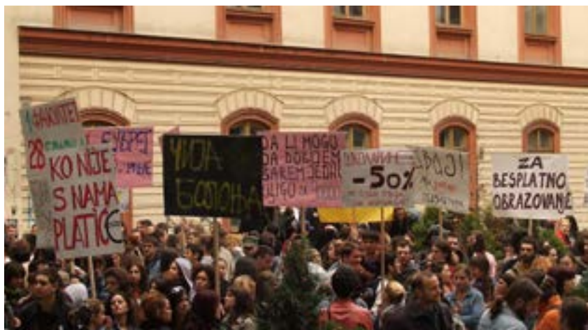
Protest na platou ispred Filozofskog 2006.

Još važnija metoda u ovom kontekstu je eskalacija zahteva, kao i metoda koji se koriste za njihovo ispunjenje. Naime, ukoliko se odmah ide na maksimalističke zahteve čije bi ispunjenje možda bilo i najbolji mogući ishod, najverovatnije je da će drugi biti ili uplašeni smelošću zahteva ili razuvereni preprekama koje stoje na tom putu, a koje zaista jesu ozbiljne. Osim toga, lako će se sagoreti oskudni resursi dostupni na početku. U takvim slučajevima, potrebno je početi sa skromnim i malim zahtevima čije je ispunjenje predvidivo i na horizontu. U tom slučaju, oba ishoda su zadovoljavajuća. Ukoliko se ti