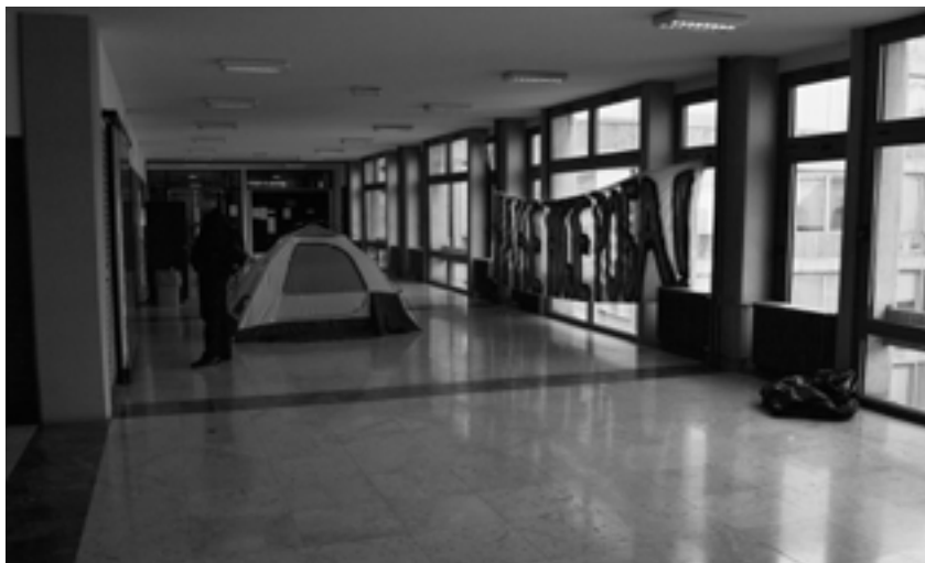
Spavanje u šatorima tokom blokade Filozofskog 2014.

Stalna pretnja studentskim protestima i blokadama fakulteta bile su grupe neonacista koje su u ovome videle priliku da se obračunaju sa studentima levičarima. Ovo je posebno došlo do izražaja 2011. tokom blokada Filološkog i Filozofskog, kada je opšti utisak učesnika protesta bio da neonacisti deluju u dosluhu sa nekim iz uprave fakulteta ili Univerziteta. Pri svakom incidentu u blizini fakulteta se nalazilo dosta policije, a tokom napada bakljom na Filozofski fakultet prisutan je bio i tadašnji PR Univerziteta Marjan Nikolić. Čak i da neonacisti nisu bili u direktnom dosluhu, prilično je jasno da je ovo bila taktika — 2011. godine tadašnji rektor je izjavio da fakultet blokiraju komunisti i anarhisti, te pozvao državu da "reši problem