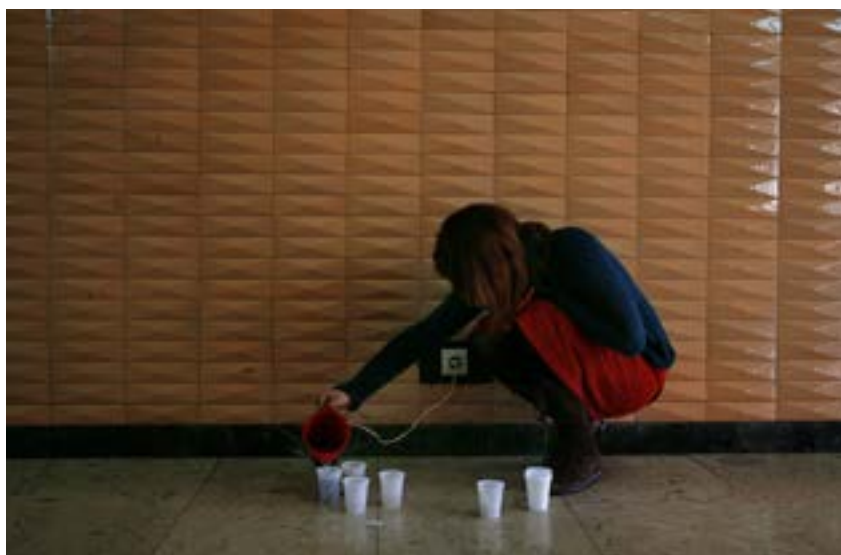
Blokada Filozofskog 2011.

je to zato što su organski došli odozdo, nije ih nametnuo neko "zna bolje", nego su se obični studenti okupili oko svojih problema i borili za svoj interes. I ja mislim da tako i treba, tako mora da počne da bi bilo ispravno, a onda ako Bog da, da preraste u nešto veće, kao što je to bio slučaj sa blokadom. Neki su zamerali što su se studenti mahom izjašnjavali kao apolitični, ali nije toliko važno ni deklarirati se ili etiketirati borbu kao levu ili desnu jer dela govore više od reči. Sama praksa je bila vrlo politična u tom širem