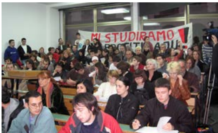
Roditeljski sastanak na Filozofskom 2006.

Mediji su javnost ubeđivali da blokade uopšte ne organizuju studenti, a studente da su sami krivi za sve što im se dešava. Sistematski je stvarana iskrivljena slika o studentima u protestu — to je imalo važnu ulogu u sprečavanju širenja protesta i pokušajima okretanja javnosti protiv studenata. Ovde ne govorimo o nekoj apstraktnoj javnosti, već o vrlo konkretnim ljudima — roditeljima studenata koji gledaju televiziju, njihovim prijateljima koji nisu deo protestnog pokreta, drugim studentima sa blokiranih fakulteta koji su se često informisali preko medija i internet portala. Bilo je roditelja