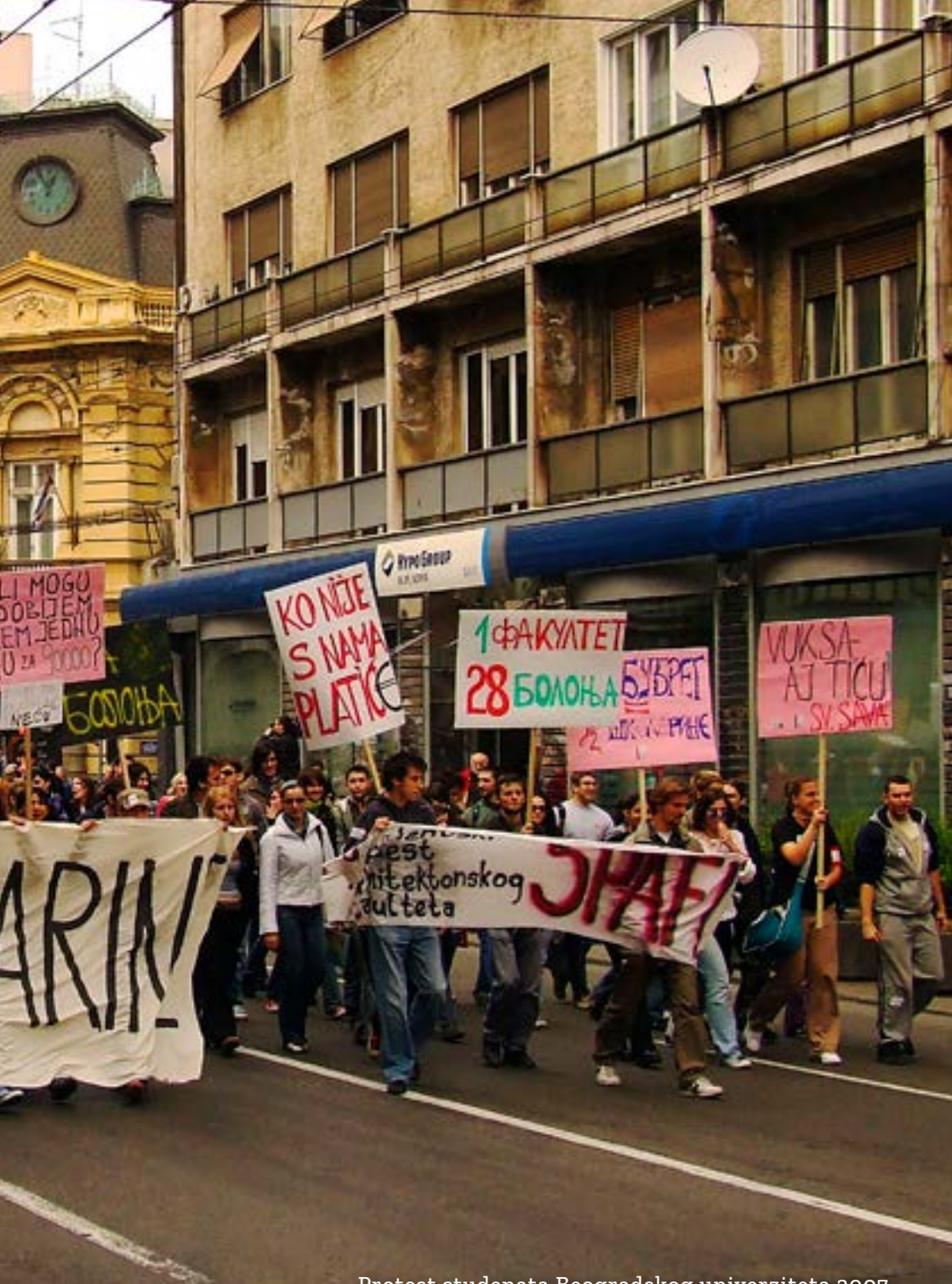
Protest studenata Beogradskog univerziteta 2007.