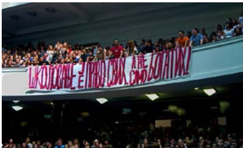
Zbor na Filološkom 2011.

Čini se da plenum jeste vrlo dobro rešenje, jer pretpostavlja jednakost, omogućava dostupnost informacija i kontrolu nad tokom odlučivanja i time čuva učesnike od prevare i izdaje njihovih interesa od strane predstavnika. Takođe, inicijalno motiviše veći broj ljudi na aktivno učešće. Ovakva organizacija je i prvi instinkt ljudi kada se nađu pred nekim problemom, oni se okupe i kao jednaki o njemu raspravljaju i odlučuju.