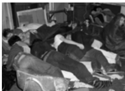
Blokada FLU 2007. i Filozofskog 2011.