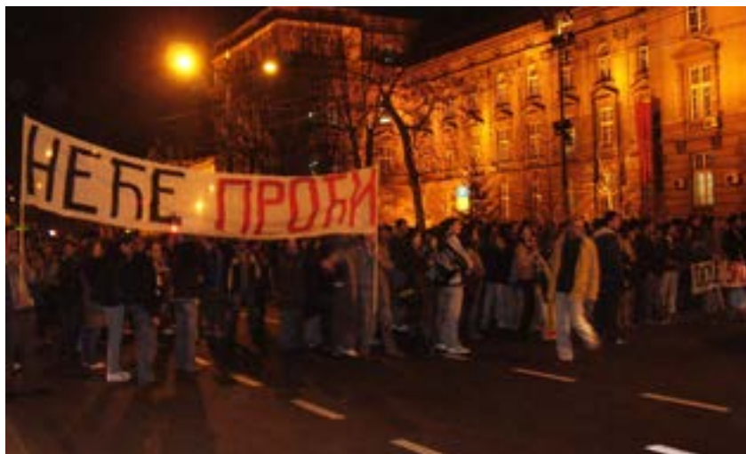
Protest ispred Arhitektonskog 2007.